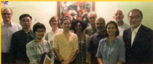
Consejo Internacional de la Carta de la Tierra (2015)