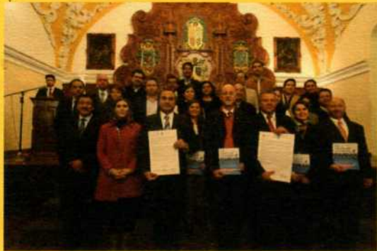
Firma de Aavales de la Auditoría Superior del Estado de Puebla. (Puebla, Pue. 2014)

Es un compromiso para utilizarla como guía y marco ético para la toma de decisiones, en el desarrollo de planes y políticas y como instrumento educativo para el desarrollo sustentable, bajo la visión y las metas del documento que busca una sociedad global que sea justa, sustentable y pacífica.