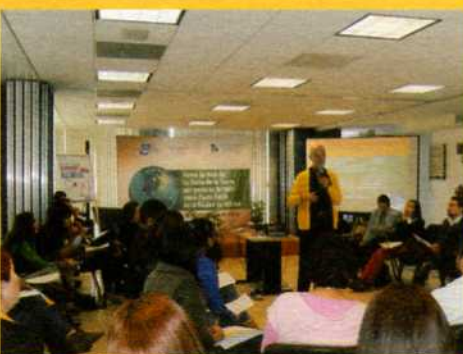
Taller sobre Carta de la Tierra a servidores públicos de la PAOT, en el marco de la Firma de Aval. (Ciudad de México, 2014).