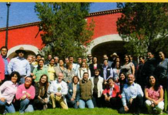
Red de Puntos Focales Coordinadores (Aguascalientes, Ags. 2013)